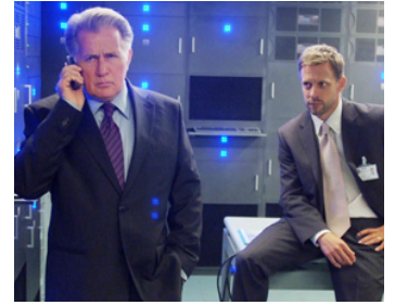
2009 CONSPIRATION (Echelon Conspiracy) de Greg Marcks avec Trevor White