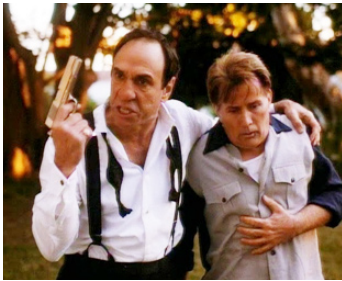
1995 DILLINGER ET CAPONE (Dillinger & Capone) de Jon Purdy avec F. Murray Abrahams