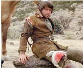
1979 L'ÉTALON DE GUERRE (Eagle's Wing) d'Anthony Harvey