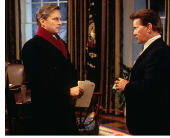
1995 LE PRÉSIDENT ET MISS WADE (The American President) de Rob Reiner avec Michael Douglas