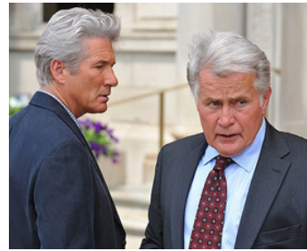
2011 SECRET IDENTITY (Secret Identity) de Michael Brandt avec Richard Gere