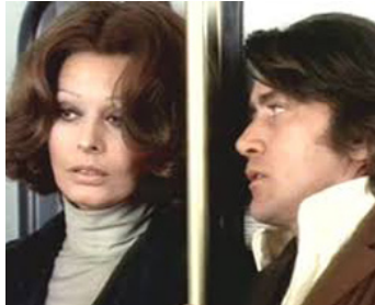
1976 LE PONT DE CASSANDRA (The Cassandra Crossing) de G. Pan Cosmatos avec Sophia Loren