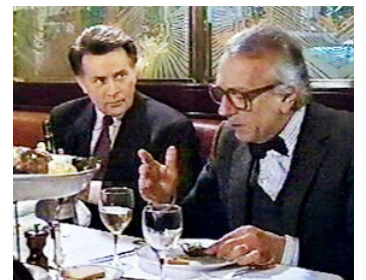
1991 THE MAID (The Maid) d'Ian Toynton avec Jean-Pierre Cassel