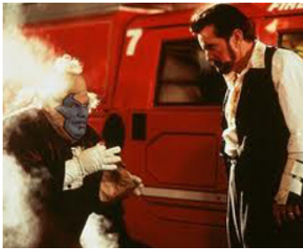
1997 SPAWN (Spawn) de Mark Dippé avec John Leguizamo