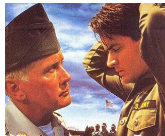
1990 CADENCE (Cadence) de Martin Sheen avec Charlie Sheen