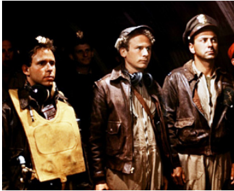
1970 CATCH 22 (Catch 22) de Mike Nichols avec Bob Balaban, Art Garfunkel