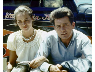
1974 CALIFORNIA KID (The California Kid) de Richard T. Heffron avec Michelle Phillips