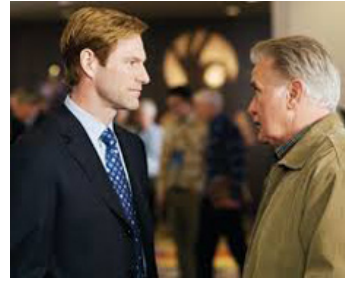
2009 LOVE HAPPENS (Love Happens) de Brandon Camp avec Aaron Eckhart