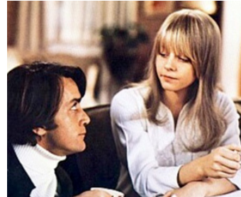
1977 LA PETITE FILLE AU BOUT DU CHEMIN de Nicolas Gessner avec Jodie Foster