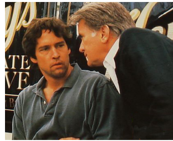
1993 HEAR NO EVIL de Robert Greenwald avec D. B. Sweeney