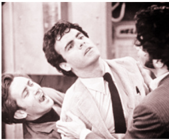
1967 L'INCIDENT (The Incident) de Larry Peerce avec Robert Fields