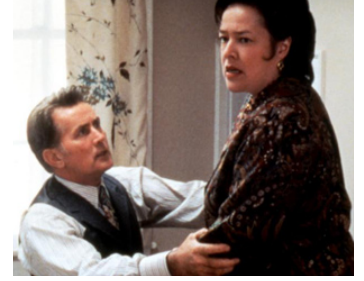
1996 THE WAR AT HOME (The War at Home) d'Emilio Estevez avec Kathy Bates