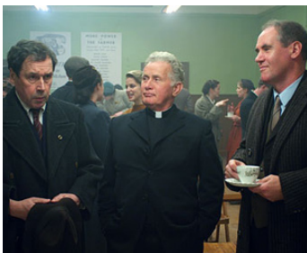
2011 STELLA DAYS (Stella Days) de Thaddeus O'Sullivan avec Stephen Rea, David Herlihy