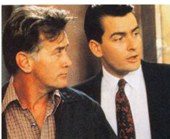
1987 WALL STREET (Wall Street) d'Oliver Stone avec Charlie Sheen