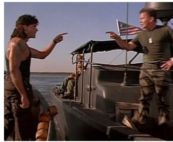
1993 HOT SHOTS 2 (Hot Shots! Part 2) de Jim Abrahams avec Charlie Sheen