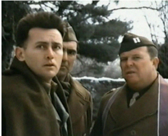
1974 EXÉCUTÉ POUR DÉSERTION (The Execution of Private Slovik) de L. Johnson avec Ned Beatty