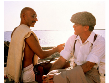
1982 GANDHI (Gandhi) de Richard Attenborough avec Ben Kingsley