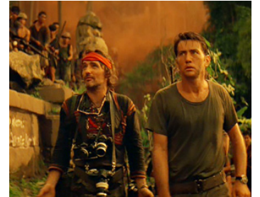
1979 APOCALYPSE NOW (Apocalypse Now) de Francis Ford Coppola avec Dennis Hopper