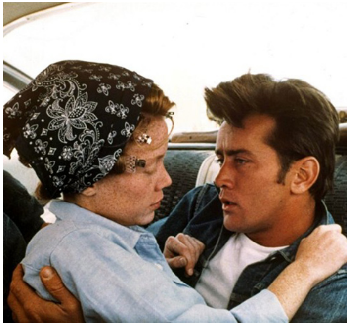
1973 LA BALADE SAUVAGE (Badlands) de Terrence Malick avec Sissy Spacek