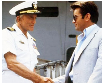
1980 NIMITZ RETOUR VERS L'ENFER (The Final Countdown) de Don Taylor avec Kirk Douglas