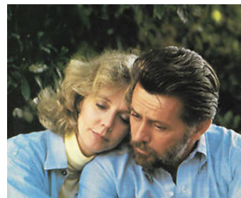
1983 UN HOMME, UNE FEMME ET UN ENFANT (Man, Woman and Child) de D. Richards avec Blythe Danner