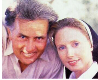
1995 GOSPA (Gospa) de Jakov Sedlar avec Morgan Fairchild