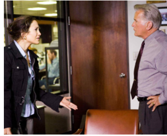
2007 LES OUBLIÉES DE JUAREZ (Bordertown) de Gregory Nava avec Jennifer Lopez