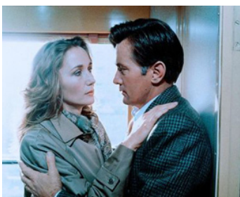
1983 ENIGMA (Enigma) de Jeannot Szwarc avec Brigitte Fossey