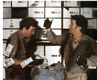
1981 LOOPHOLE (Loophole) de John Quedsted avec Albert Finney