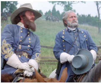
1993 GETTYSBURG (Gettysburg) de Ronald F. Maxwell avec Tom Berenger