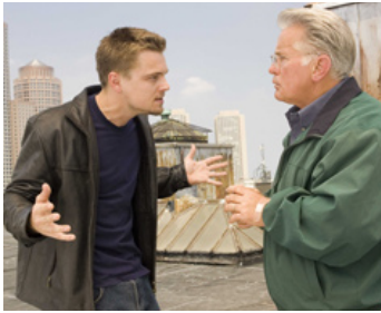
2006 LES INFILTRÉS (The Departed) de Martin Scorsese avec Leonardo Di Caprio