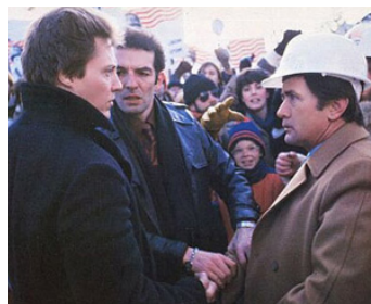
1983 DEAD ZONE (Dead Zone) de David Cronenberg avec Christopher Walken