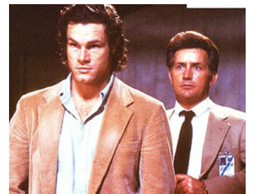
1984 CHARLIE (Firestarter) de Mark L. Lester avec David Keith