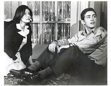
1968 THE SUBJECT WAS ROSES d'Ulu Grosbard avec Patricia Neal