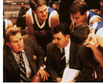
2001 OTHELLO 2003 (Othello 2003) de Tim Blake Nelson